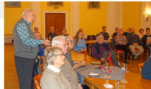
Großes Interesse in Fürstfeldbruck.