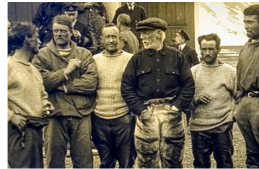
Amundsen (mit Mütze) und seine Crew überlebten die Nordpol-Expedition mit zwei Wal-Flugbooten nur knapp. Im Eis mussten sie mühsam eine Startbahn bauen.